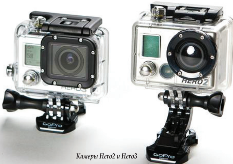
Камеры Hero2 и Hero3