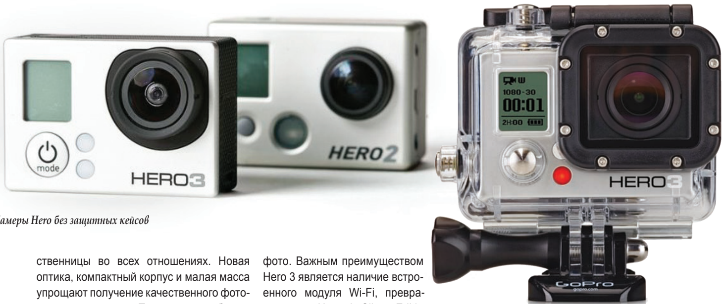
Камеры Hero без защитных кейсов

стенницы во всех отношениях. Новая оптика, компактный корпус и малая масса упрощают получение качественного фото- и видеоматериала. Программное обеспечение Protune позволяет расширить диапазон профессионального использования новинки. Картинка с новой камеры выглядит лучше, и это касается как видео, так и